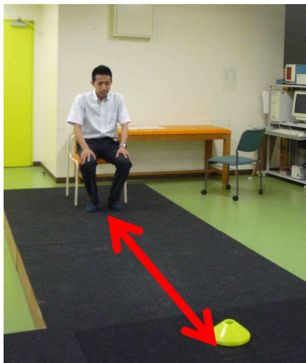
いすの先端～コーンの外側：3m

【必要物品：ストップウォッチ、椅子、コーン（無ければ色のついたペットボトルなどで代用）、メジャー（設定時）】