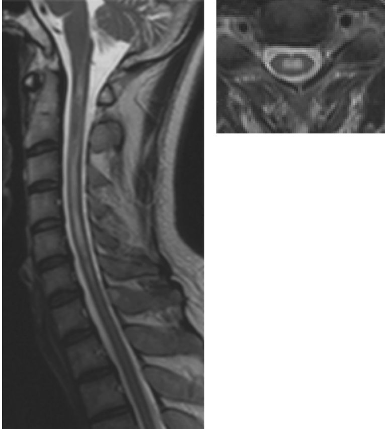
図1) MRI 矢状断 延髄～頸髄にかけてT2WIにて高信号 水平断 第3頸椎レベル 中心灰白質などにT2WIにて高信号