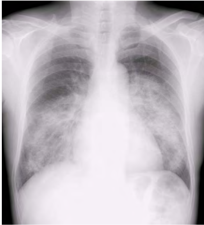
図1 肺胞出血を起こした際の胸部X線写真