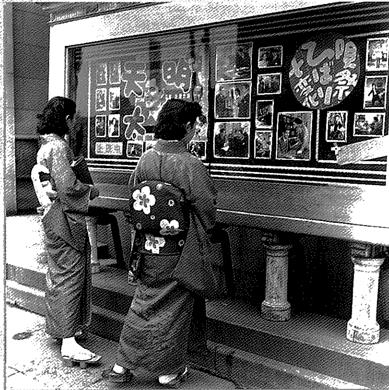
映画看板を眺める 着物の女性・大阪