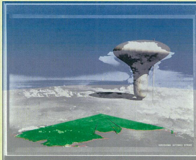
Baba. Black rain workshop at RIRBM(2010)