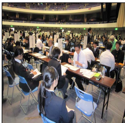
面接会場の全体風景

また、昨夏には、学校側が指導記録等を消失したことによる新規学卒者の就職活動上の不利益にならないように配慮を求めるものや、被災学生の求人確保・採用枠拡大の要請などを、主要経済団体等に対して実施した。