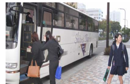
【写真6：仙台での面接会を終えてバスに乗る生徒】