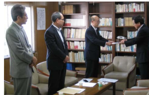
【写真3：福島における要請】