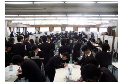
【写真7：面接会に臨む学生】