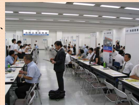
【写真5：企業と高校進路指導担当者の説明会】