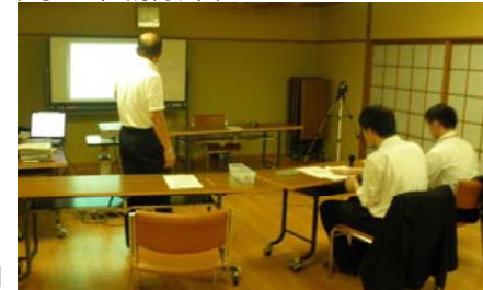
【写真9:労働大学校宿泊中に開催された就職支援セミナー】