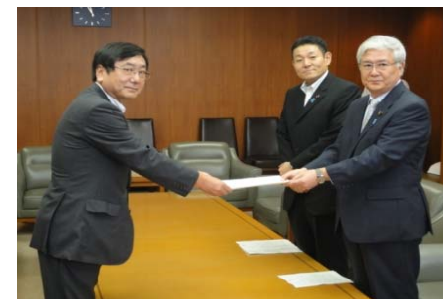
【写真4：文科・厚労における要請】