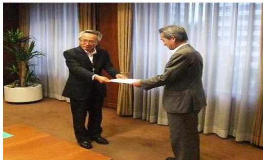
【写真2：宮城における要請】