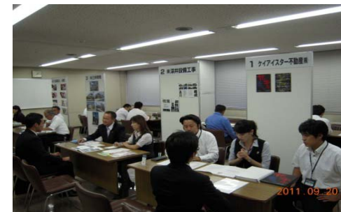
【写真8:被災新卒者と首都圏企業の面接会】