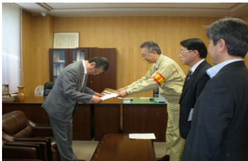
【写真1：岩手における要請】