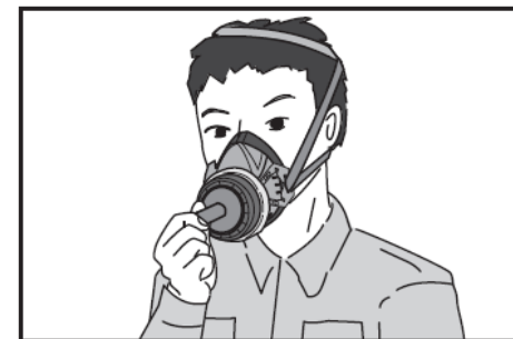
(B) フィットチェッカーを用いた方法

吸気口を手でふさぐときは、押しつけて面体が押されないように、反対の手で面体を押さえながら息を吸い、苦しくなれば空気の漏込みがないことを示す