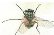
イエバエ(体長5~8mm) 積極的に家屋に侵入する習性があります。