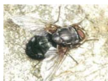
クロバエ類(体長7~12mm) 体は大型で丸みを帯び、屋外で活動する習性があります。