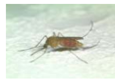
アカイエカ(体長約5.5mm) 初夏~秋にかけて成虫が見られ、主として夜間に人を吸血します。