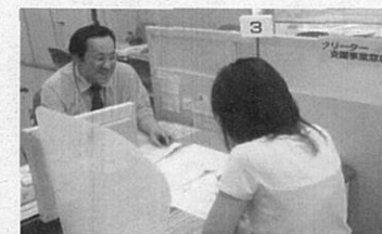
ハローワークに設置されたフリーター向けの窓口

全国のハローワークにおいて、支援対象者一人ひとりの課題に応じ、就職活動に関する個別相談・指導助言、継続的な求人情報の提供、面接会の開催、職業相談・職業紹介、職場定着支援など、必要に応じて担当者制により、正規雇用化のための一貫した支援を実施。