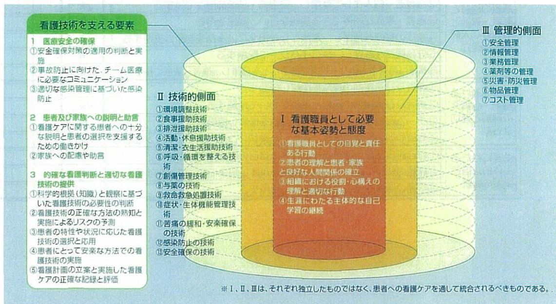
図2 臨床実践能力の構造

看護は必要な知識、技術、態度を統合した実践的能力を、複数の患者を受け持ちながら、優先度を考慮し発揮することが求められる。そのため、臨床実践能力の構造として、Ⅰ基本姿勢と態度 Ⅱ技術的側面 Ⅲ管理的側面が考えられる(図2)。これらの要素はそれぞれ独立したものではなく、患者への看護を通して臨床実践の場で統合されるべきものである。また、看護基礎教育で学んだことを土台にし、新人看護職員研修で臨床実践能力を積み上げていくものである。