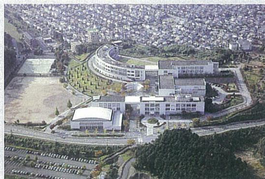
大分県立看護科学大学 全景