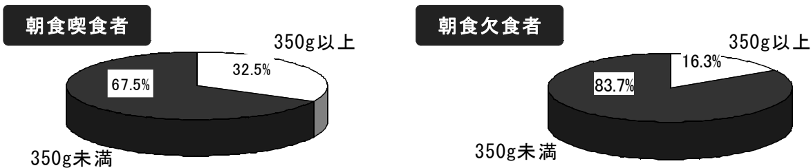
図21 朝食の喫食状況別・野菜摂取量の分布割合（20歳以上）

朝食の喫食別に野菜摂取量をみると、野菜を350g以上食べている者の割合は、朝食喫食者で32.5%、朝食欠食者で16.3%であった。