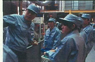
機械工作の仕事の体験風景