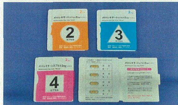
メトトレキサートカプセル2mg「マイラン」 (マイラン製薬株式会社)