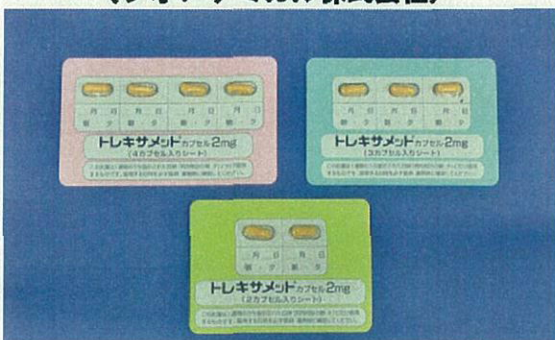
トレキサメットカプセル2mg (シオノケミカル株式会社)