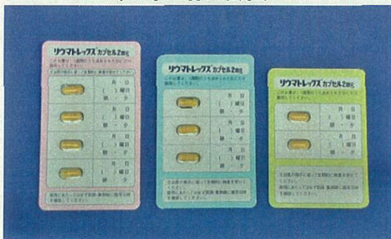
リウマトレックスカプセル2mg (ワイス株式会社)