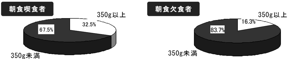
図21 朝食の喫食状況別・野菜摂取量の分布割合（20歳以上）

朝食の喫食別に野菜摂取量をみると、野菜を350g以上食べている者の割合は、朝食喫食者で32.5%、朝食欠食者で16.3%であった。