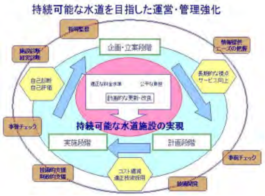
図6-5 持続可能な水道を目指した運営・管理強化アクションプログラム

総人口の減少等の社会情勢の変化に適切に対応し、現在及び将来の需要者の視点に立脚した信頼性の高い持続可能な水道を実現する。水道事業者等は、需要構造の変化に応じた適正な水道料金の設定、費用の公平な負担、各種法規制を遵守する体制の確立等を図った上で、中長期的な財政収支に基づく計画的な施設更新・改良を推進する必要がある。このためには、公平性の確保に留意しつつ、事前チェック、技術的・財政的支援、事後チェック等の制度・体制の再構築を行うことが必要であり、速やかにその実現を図る。