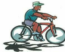
自転車置き場管理