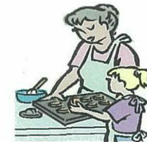
子育て支援 サービス