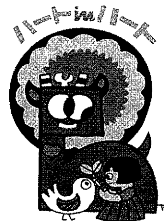
シンボルマーク“牛鬼” 郷土の版画家 兵頭俊朗 画