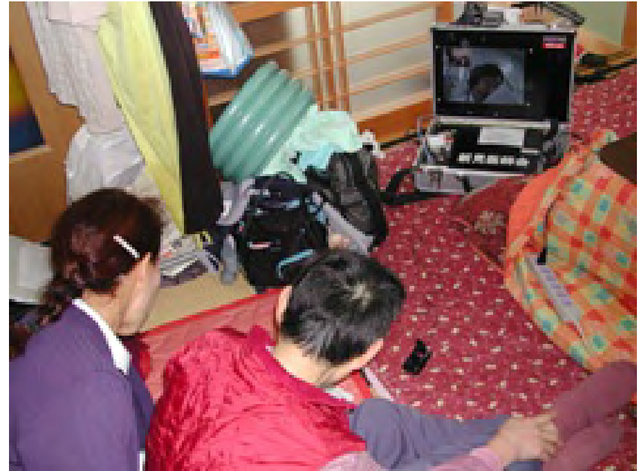
実施状況3(療養者側)