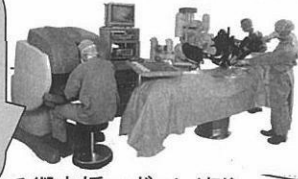
手術支援ロボット(例)