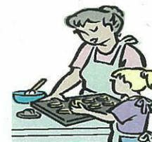
子育て支援 サービス