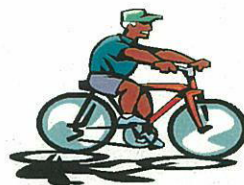
自転車置き場管理