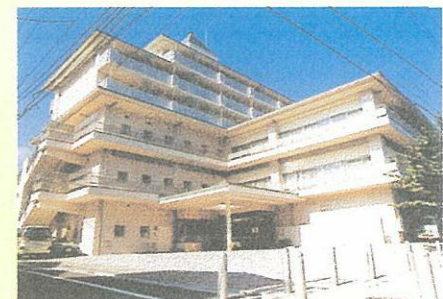
品川区立中延複合施設（特別養護老人ホーム、在宅サービスセンター、在宅介護支援センター）