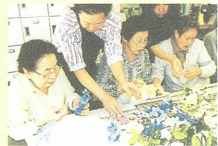
品川区立大井在宅サービスセンター