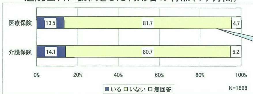
退院当日に訪問をした利用者の有無(1ヶ月間)