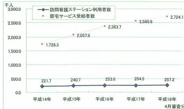
訪問看護利用者数の推移