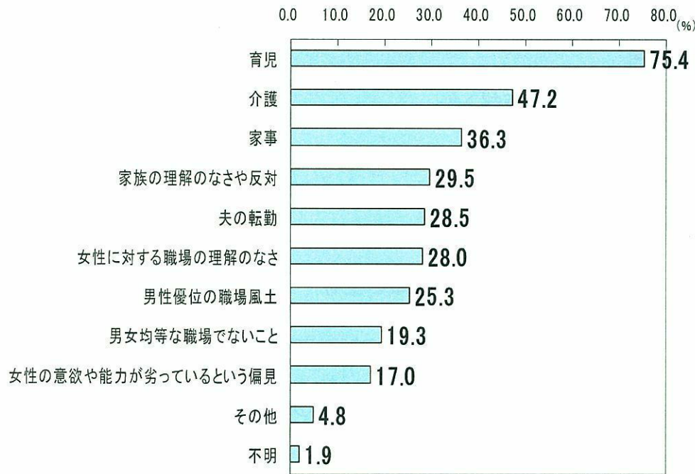
女性が働き続けるのを困難したり障害になること