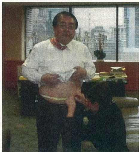
管理栄養士による腹囲測定の様子