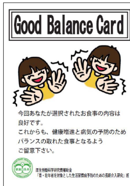
図3 イエローカードとグッドバランスカードの例示