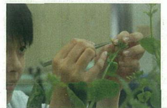
アブラナ科植物の育種（胚培養）