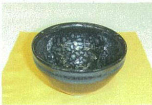
油滴天目茶碗の斑点模様（試作品）