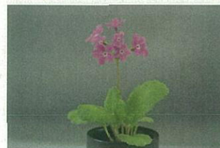
商品化に成功したサクラソウ