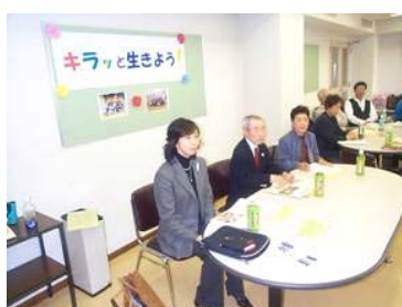
メンバーの発案で1泊合宿桶川市健康づくり市民会議と交流(H16.2.28～29)