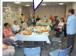
ちょっとした宴会も