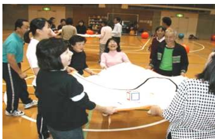
女子栄養大学で運動と食事を楽しむ(いい汗かいて楽しい食事♪)