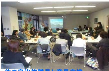
他の自治体職員と意見交換(H16.3.19) 埼玉県主催の健康福祉研究発表会