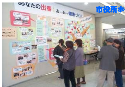
市役所ホールでPR活動