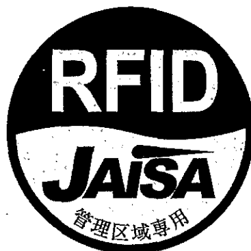
図2 管理区域専用RFID機器用ステッカ

注1：ここでは、公共施設や商業区域などの一般環境下で使用されるRFID機器を対象としており、工場内など一般人が入ることができない管理区域でのみ使用されるRFID機器（管理区域専用RFID機器）については対象外としている。なお、管理区域専用RFID機器については、(社)日本自動認識システム協会において、一般環境への流出を防止するため、取扱説明書等に注意書きを記載するとともに、管理区域専用RFID機器用ステッカ（図2）を添付することとされている。