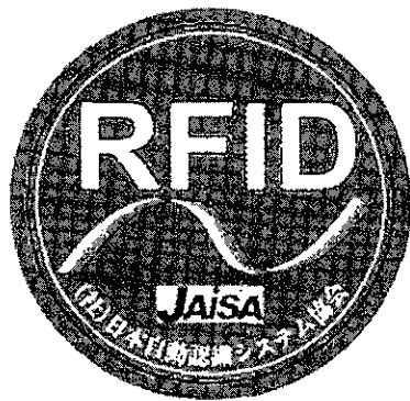
ゲートタイプRFID機器用