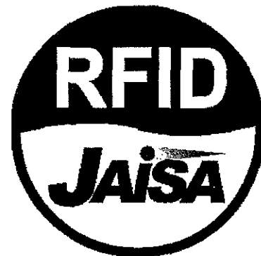
その他のタイプのRFID機器用