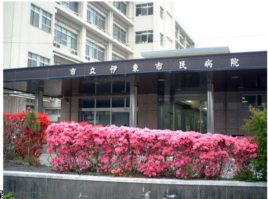
市立伊東市民病院 へき地保