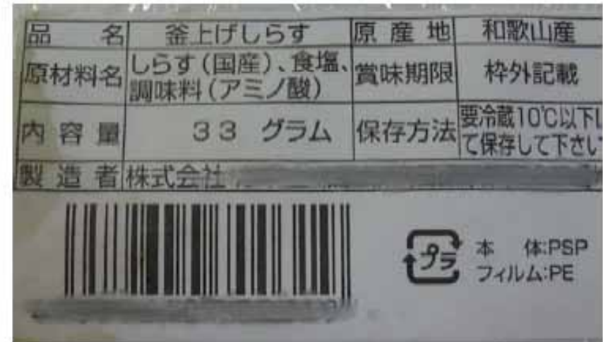
裏面に別途一括表示