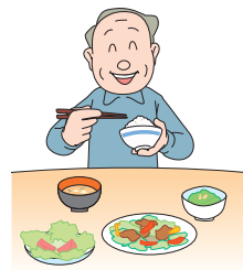
十分な休養と バランスのとれた栄養