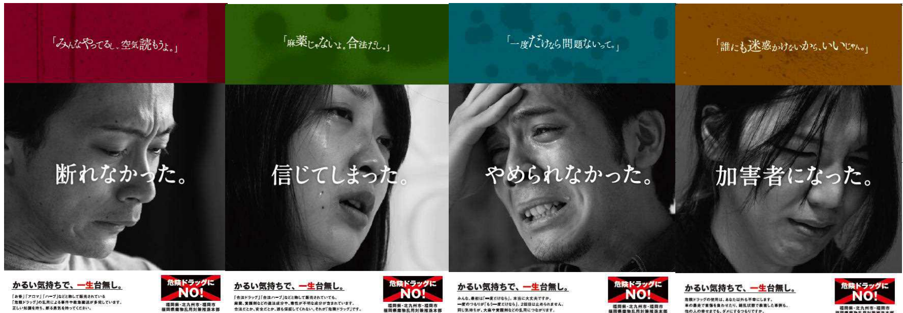
福岡県作成 危険ドラッグ乱用防止啓発駅貼りポスター画像