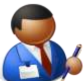
ケアマネージャー

疾患名・病歴 服薬情報 医療処置情報 要介護度 胃瘻の希望 心肺蘇生の希望等の事 前指示