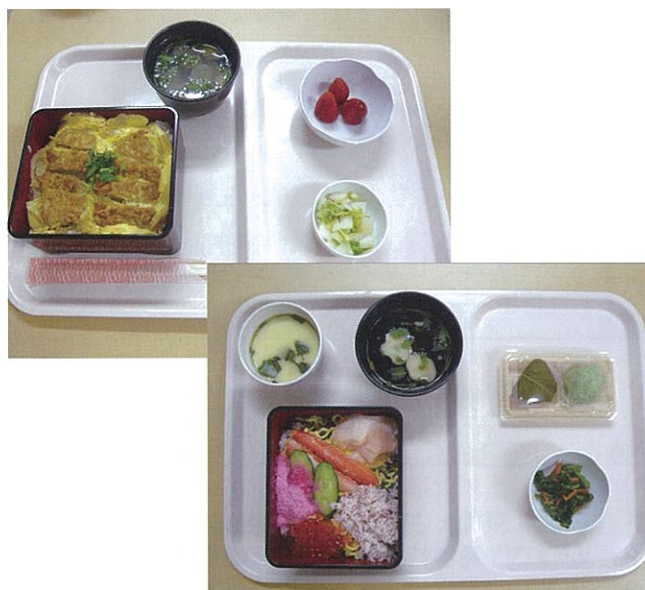
写真：2月にお出したカツ重と、3月のひな祭りにお出したちらし寿司です。