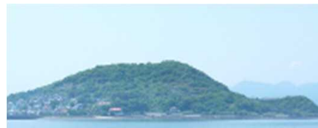
〈離島のため、地理的条件が悪い〉