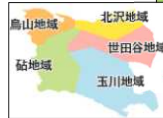
世田谷区の地域図