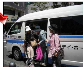
ボランティアが添乗