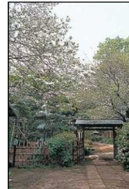
区民の土地を一般に開放した市民緑地(北烏山九丁目屋敷林)