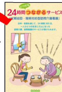
定期巡回・随時対応型訪問介護看護のパンフレット