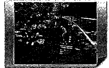
【栃木県】外来植物の取り抜き作業の状況