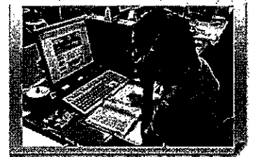
【北海道留萌市】 観光情報の収集・発信

○ 愛媛県 【雇用者数6名】 えひめ観光イベントPRキャラバン隊が愛媛ゆかりの小説や歴史上の人物にふんして、全国を訪問し、「しまなみ海道」開通10周年と秋から放送されるドラマ「坂の上の雲」等、愛媛の魅力PRする。