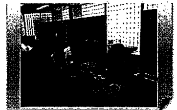
【新潟県】 空港における英語案内スタッフ