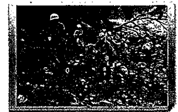
【三重県菟野町】散策路の整備