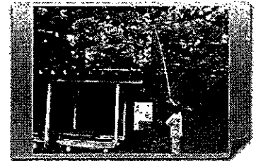
【岩手県久慈市】マイマイガの早期駆除