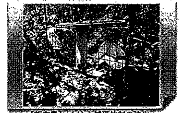
【栃木県】イノシシ捕獲体制の強化