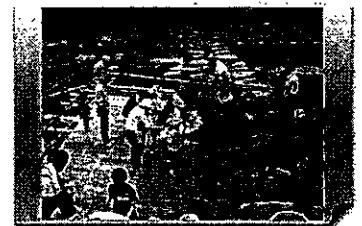
【奈良県】 「観光やな場」の管理