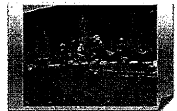
【神奈川県】岩礁地帯のゴミ収集