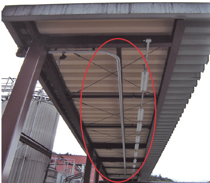
図 4-32 建屋天井に設置したレール。運転手が安全帯を着けても容易に移動できるようにしている。