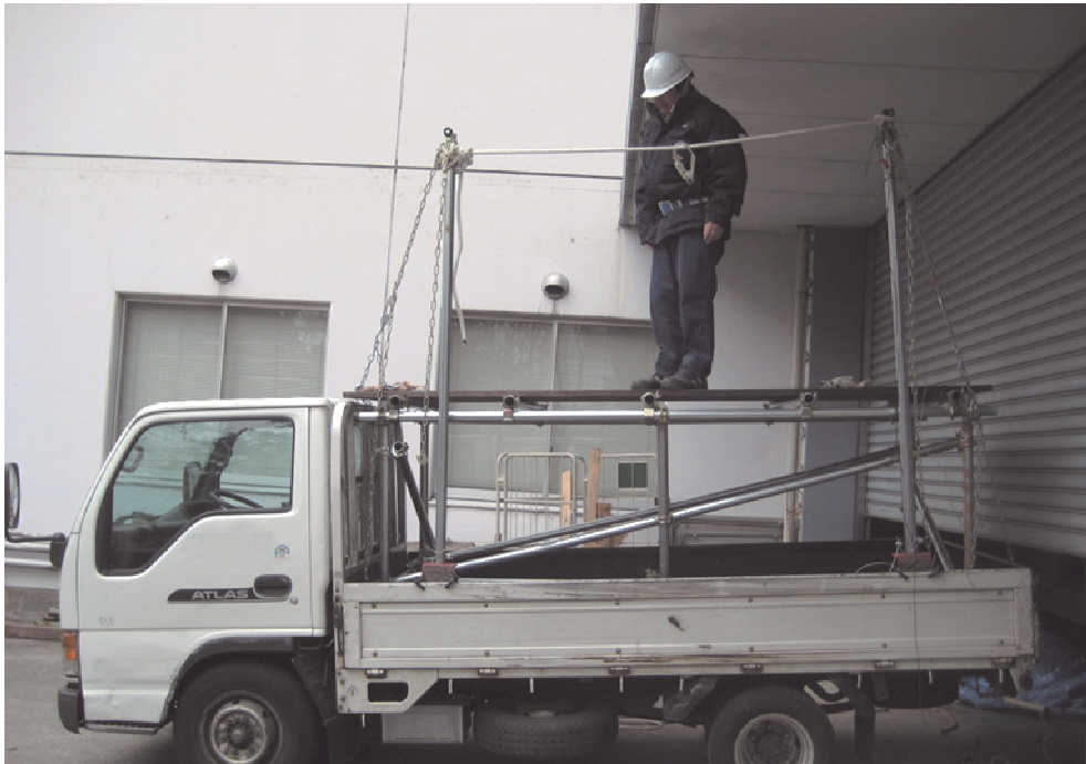
図 3-16 作業員墜落時に支柱が倒れないよう、チェーンとターンバックルで斜め後方に控えを取った状態

(手順 4) 作業員墜落時に支柱が倒れないよう、チェーンとターンバックルで斜め後方に控えを取る。(図 3-16)