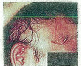
アトピー性脱毛症

さらに、頭がかゆくてついつい掻いているうちに、治りにくい脱毛症になることもあります。目のまわりを掻いているうちに、白内障になったり網膜剥離になったりして、視力障害が起こることもあります。かゆみと引っ掻き行動には、十分な注意と対処が必要です。