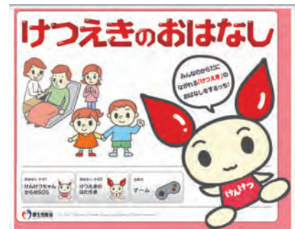
図2-4 けつえきのおはなし