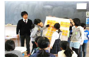
1 小学校でのサポーター養成講座(山鹿市)