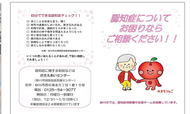
2 認知症初期集中支援チームの案内(砂川市)