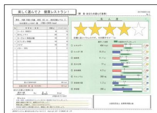
(フードモデルで食事診断書を作成)