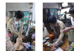
(在宅での調理指導の様子)