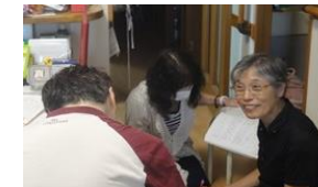
(在宅の療養者への訪問栄養食事指導の様子)