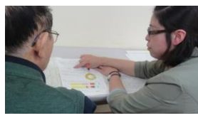
(個別栄養相談の様子)