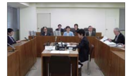
労働委員会での審議の様子

また、労使間で起きた様々なトラブルを解決するため、各都道府県に都道府県労働委員会が、また厚生労働省の外局として中央労働委員会が設置されています。