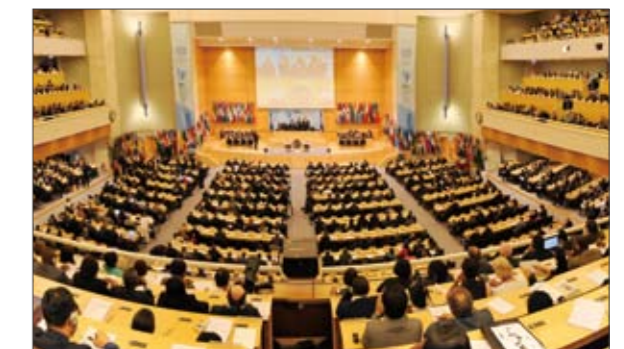
ILO 総会（2011年6月）

これらの多様な国際政策の展開を図るべく、厚生労働省職員は 20 か国以上の国々の国際機関や在外公館等に派遣され、外交の第一線でも活躍しています。今や、厚生労働省の持つ知識や経験が世界につながり、日本の厚生労働行政を世界に発信する時代になっているのです。