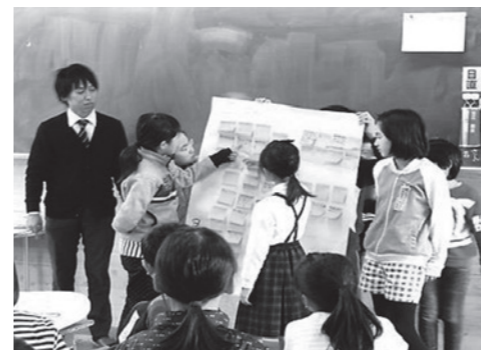
小学校で行われたサポーター養成講座

ランについて、地域資源を活用して取り組んでいる自治体のなかから4つの自治体を対象に、実施状況を調査しました。認知症の人が自分らしく暮らし続けることができる地域づくりについて、自治体が地域資源を活用しながら主体的に進めている取り組み内容などを報告することで、他自治体、関係機関などに参考情報として活用してもらうことを目的としています。