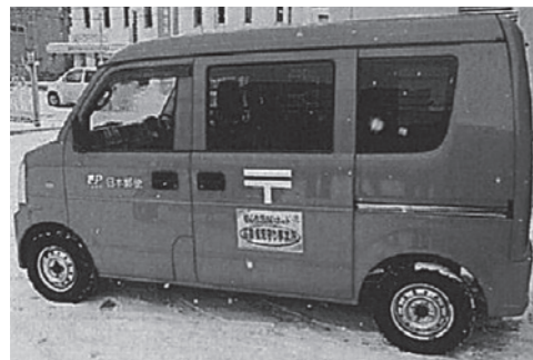
見守りステッカーを貼っている事業者