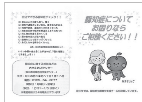
認知症初期集中支援チームの案内

認知症初期集中支援チーム（以下、「集中支援チーム」）は、認知症を初期段階で把握し、適切な医療・介護につなげることを目的としています。砂川市で