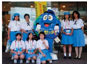
街頭キャンペーン