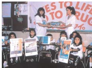
支援プロジェクト (中米・グアテマラ)