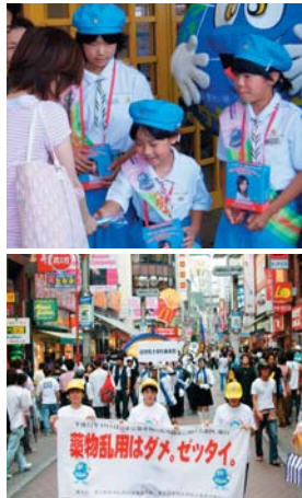
街頭キャンペーン